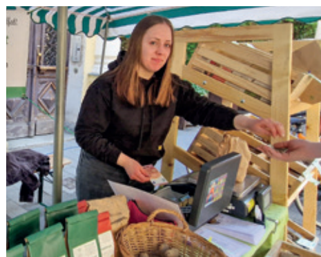
Am Biomarkt in der Lange Gasse ist immer was los!

Der Einkauf auf den Josefstädter Märkten hilft sich gesund zu ernähren und dem Klimaschutz. Studien belegen, dass Bio-betriebe nur 25% der Menge an Treibhausgasen konventioneller Betriebe erzeugen sowie für Bodengesundheit und Artenvielfalt sorgen. Die Märkte sind außerdem Orte der Begegnung, des sozialen Miteinanders und des Austausches mit den Bäuer:innen. ■