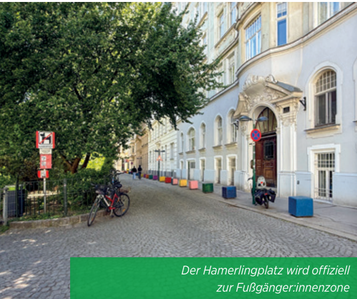
Der Hamerlingplatz wird offiziell zur Fußgänger:innenzone

des Platzes wird auch die Sicherheit für Fußgänger:innen an dieser manchmal doch recht unübersichtlichen Kreuzung erhöht. Damit wird auch auf das Bedürfnis der Volksschüler:innen der Josefstadt eingegangen, die im Rahmen des Schüler:innenparlaments geäußert haben, sich an dieser Kreuzung Verbesserungen zu wünschen. Fazit: Wir reduzieren den Durchzugsverkehr, schaffen mehr Freiräume für Fußgänger:innen und verhehlen der modernen Mobilität zum Durchbruch! ■