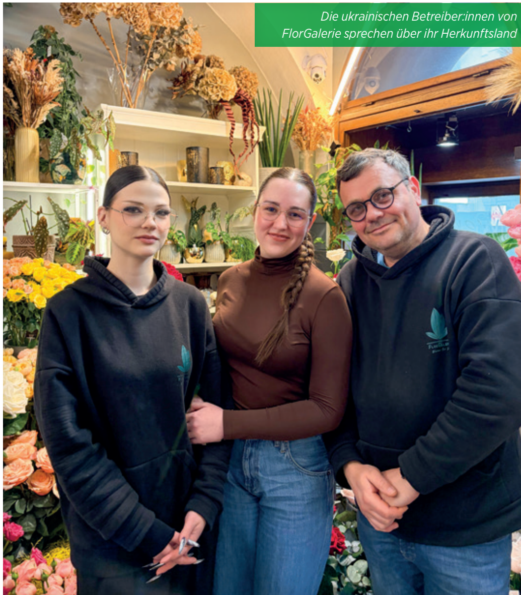
Die ukrainischen Betreiber:innen von FlorGalerie sprechen über ihr Herkunftsland