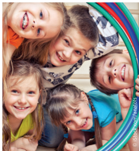
Das Josefstädter Ferienspiel ist das kostenlose Sommerferienprogramm der Bezirksvorstehung

Ein spannender Einblick in die Medienwelt erwartet Teilnehmer:innen bei der Kinderredaktion am 21. und 22. 07. jeweils