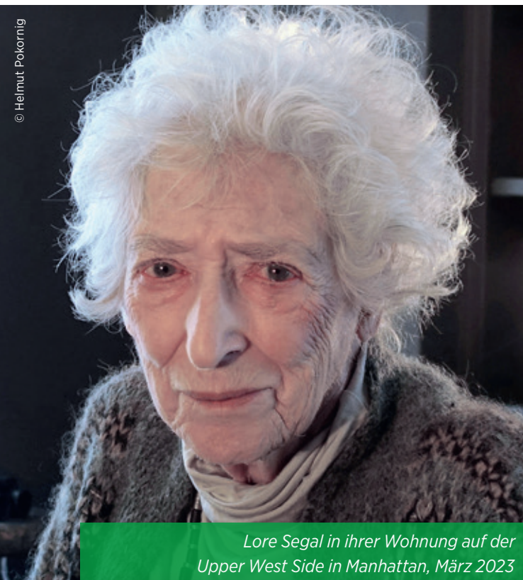
Lore Segal in ihrer Wohnung auf der Upper West Side in Manhattan, März 2023